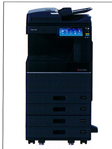
TOSHIBA e-STUDIO 2505AC

POUR UN COPIEUR TOSHIBA e-STUDIO 2505AC. (Réf.: 2505/917)